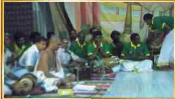
மஹாரண்யம் சுற்றி உள்ள கிராம ஆன்பர்களின் "பத்ராசலம் ராமதாசர்"