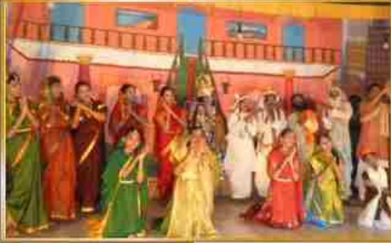
தூத்துக்குடி கேந்திராவின் "சாந்த சக்ரபாய்"