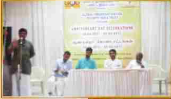
குளோபல் ஆர்கனைசேஷன் ஃபார் டிவினிடீ ஆண்டு விழா ஏப்ரல் 30, மே 1, 2 - தூத்துக்குடி.