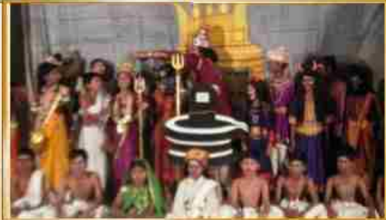
ஆம்பாசமுத்திர சத்சங்கத்தினரின் "பக்த மார்க்கண்டேயன்"